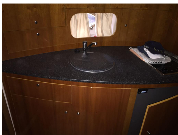
INNOVAZIONE E PROGETTI MIRA 43' (11)