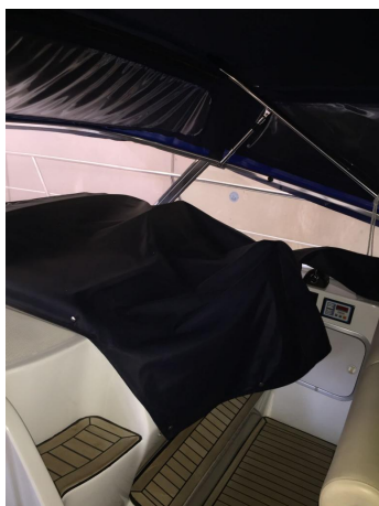
INNOVAZIONE E PROGETTI MIRA 43' (5)