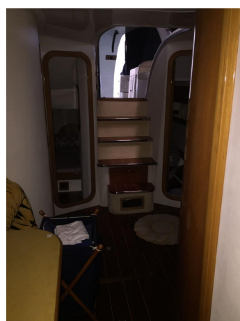
INNOVAZIONE E PROGETTI MIRA 43' (12)