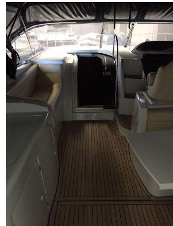
INNOVAZIONE E PROGETTI MIRA 43' (4)