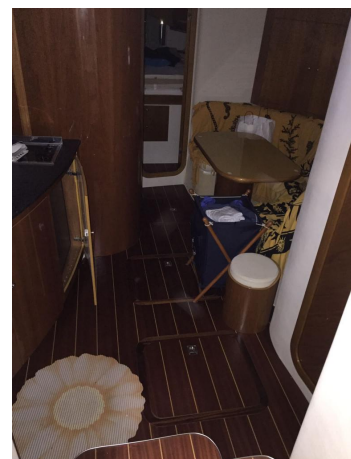
INNOVAZIONE E PROGETTI MIRA 43' (6)