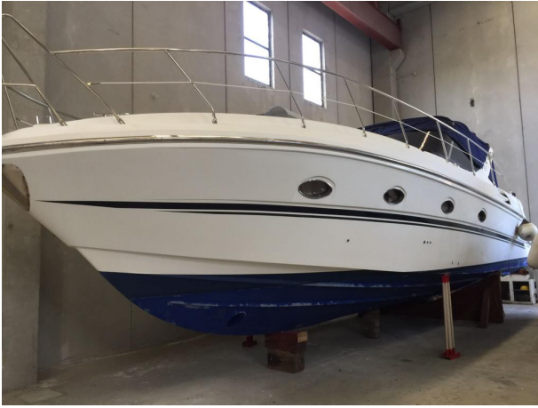
INNOVAZIONE E PROGETTI MIRA 43' (1)