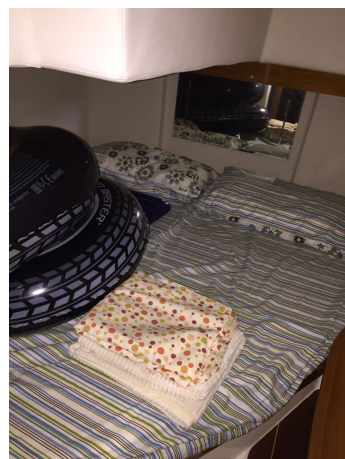
INNOVAZIONE E PROGETTI MIRA 43' (8)