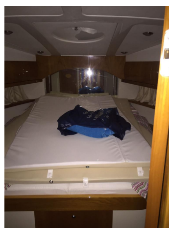
INNOVAZIONE E PROGETTI MIRA 43' (10)