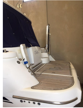
INNOVAZIONE E PROGETTI MIRA 43' (2)