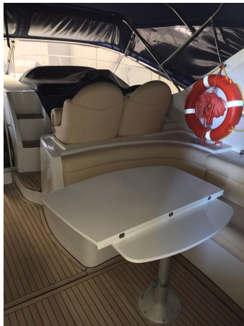
INNOVAZIONE E PROGETTI MIRA 43' (3)