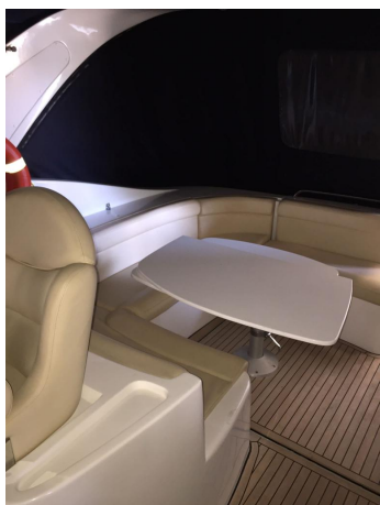
INNOVAZIONE E PROGETTI MIRA 43' (7)